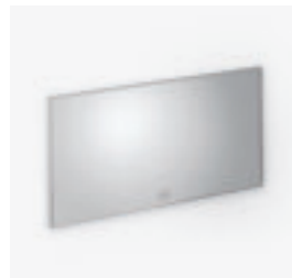
42 600 979* Fragrance module for RainSky E Modulo essenze per RainSky E Difusor de esencias aromáticas para RainSky E