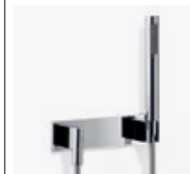
27 818 980 Complete hand shower set Gruppo doccia con flessibile a muro Juego de ducha de mano con codo de conexión a pared [14 l/min.]

* The rough parts kit for this product can be found on pages 103-105. / Il kit componenti interni di questo prodotto si trova alle pagine 103-105. / Encontrará el juego de premontaje correspondiente a este producto en las páginas 103-105.