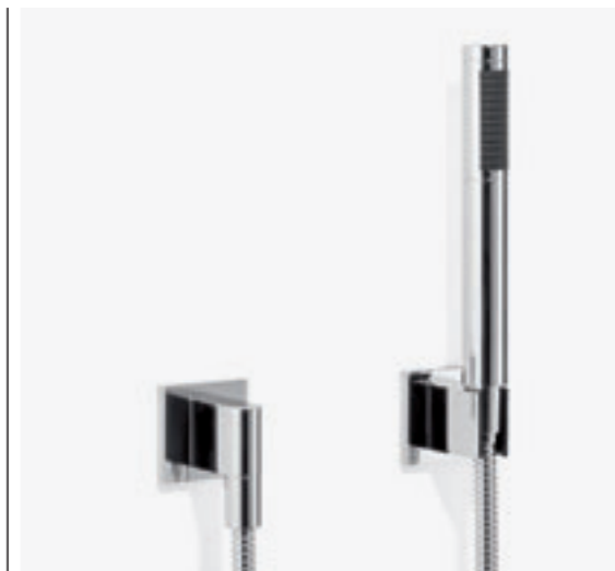
27 808 980 Complete hand shower set Gruppo doccia con flessibile a muro Juego de ducha de mano con codo de conexión a pared [14 l/min.]