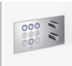
42 700 979* Electronic control for RainSky E Comando elettronico per RainSky E Control electrónico para RainSky E