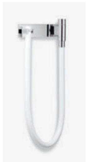
27 826 979 + 28 285 979 / 28 286 979 WaterTube Kneipp hose white/black with valve and hose holder / WaterTube tubo flessibile Kneipp bianco/nero con rubinetto e supporto per tubo flessibile / WaterTube manguera Kneipp blanco/ negro con válvula y soporte para manguera [68 l/min.]