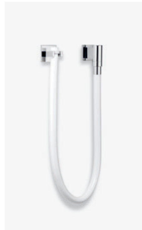
27 822 979 + 28 285 979 / 28 286 979 WaterTube Kneipp hose white/black with hose holder WaterTube tubo flessibile Kneipp bianco/nero con supporto per tubo flessibile WaterTube manguera Kneipp blanco/ negro con soporte para manguera [68 l/min.]