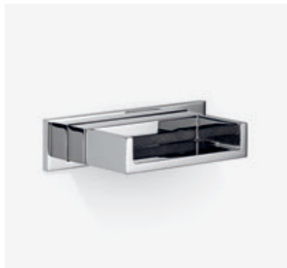
13 420 979 WaterFall 1/2" wall-mounted cascade spout WaterFall bocca di erogazione a cascata per montaggio a muro 1/2" WaterFall salda en cascada para montaje a pared 1/2" [25 l/min.]