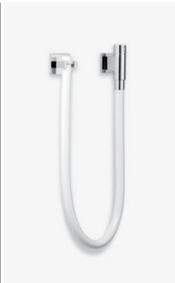
27 821 979 + 28 285 979 / 28 286 979 WaterTube Kneipp hose white/black with valve and hose holder WaterTube tubo flessibile Kneipp bianco/nero con rubinetto e supporto per tubo flessibile WaterTube manguera Kneipp blanco/ negro con válvula y soporte para manguera [68 l/min.]