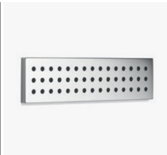
36 517 979* WaterBar concealed body spray WaterBar soffione laterale incasso WaterBar ducha lateral empotrada [5 l/min.]