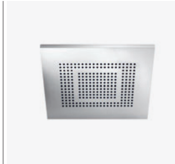
41 400 979** BigRain for ceiling installation/ceiling substructure installation BigRain per installazione ad incasso in controsoffitto/a soffitto BigRain para montaje empotrado en techo/montaje sobre techo [40 l/min.]