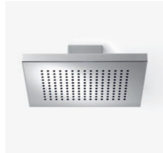
41 507 979*** JustRain to fix under the ceiling JustRain con fissaggio a soffitto JustRain con fijación a plafón [46 l/min.]