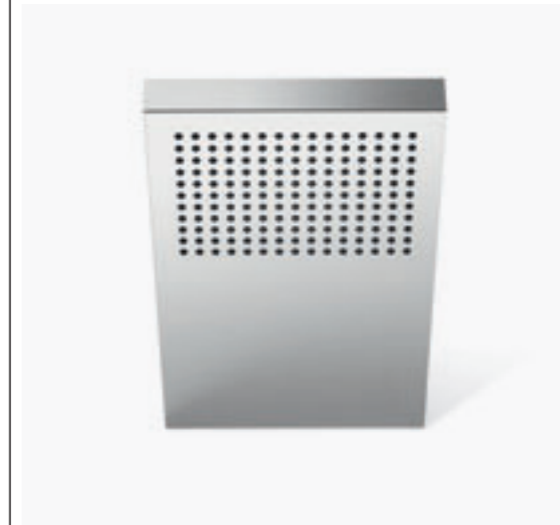
41 550 979*** JustRain with wall fixing JustRain con fissaggio a muro JustRain con fijación a pared [17 l/min.]