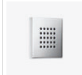
36 515 979* WaterPoints concealed body spray WaterPoints soffione laterale incasso WaterPoints ducha lateral empotrada [5 l/min.]

Excerpt from the product range. BALANCE MODULES can be combined with all the Dornbracht fittings series. More detailed information can be obtained from your dealer. / Estratto dalla gamma completa prodotti. BALANCE MODULES sono abbinabili a tutte le serie di rubinetterie Dornbracht. Il Vostro rivenditore specializzato sarà lieto di fornirvi maggiori informazioni. / Extracto del programa de productos. BALANCE MODULES se pueden combinar con todas las griferías de serie de Dornbracht. Su comercio le facilitará informaciones exhaustivas.