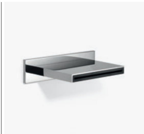
13 415 979 WaterSheet 1/2" wall-mounted cascade spout WaterSheet bocca di erogazione a cascata per montaggio a muro 1/2" WaterSheet salda en cascada para montaje a pared 1/2" [25 l/min.]