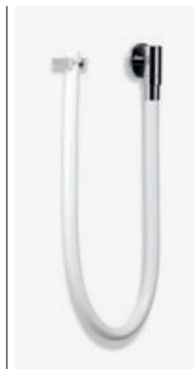
27 820 979 + 28 285 979 / 28 286 979 WaterTube Kneipp hose white/black with hose holder / WaterTube tubo flessibile Kneipp bianco/nero con supporto per tubo flessibile / WaterTube manguera Kneipp blanco/ negro con soporte para manguera [68 l/min.]