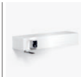
31 803 770 IAM wall-mounted single-lever basin mixer with housing, 185 mm projection IAM miscelatore monocomando lavabo incasso con contenitore, sporgenza 185 mm IAM batería monomando empotrada para lavabo con bastidor, saliente 185 mm [6 l/min.]