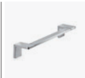
83 030 980 Bath grip, 300 mm Maniglia d'appoggio, 300 mm Barra para bañera, 300 mm