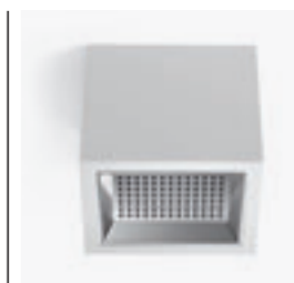
28 580 770** SATI shower to fix under the ceiling SATI soffione a pioggia con fissaggio a soffitto SATI ducha de lluvia con fijación a plafón [21 l/min.]

Excerpt from the product range. More detailed information can be obtained from your dealer. / Estratto dalla gamma completa prodotti. Il Vostro rivenditore specializzato sarà lieto di fornirvi maggiori informazioni. / Extracto del programa de productos. Su comercio le facilitará informaciones exhaustivas.