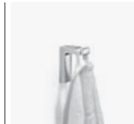
83 251 980 Hook Gancio Gancho