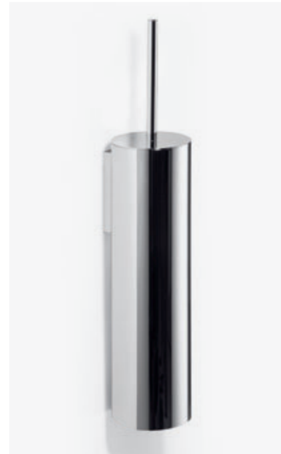
83 910 979 / 84 910 979 Toilet brush set wall/free-standing model, complete Portaspazzola WC con spazzola modello da parete/da appoggio, completo Juego de cepillo para WC completo, modelo de pared/de colocación independiente