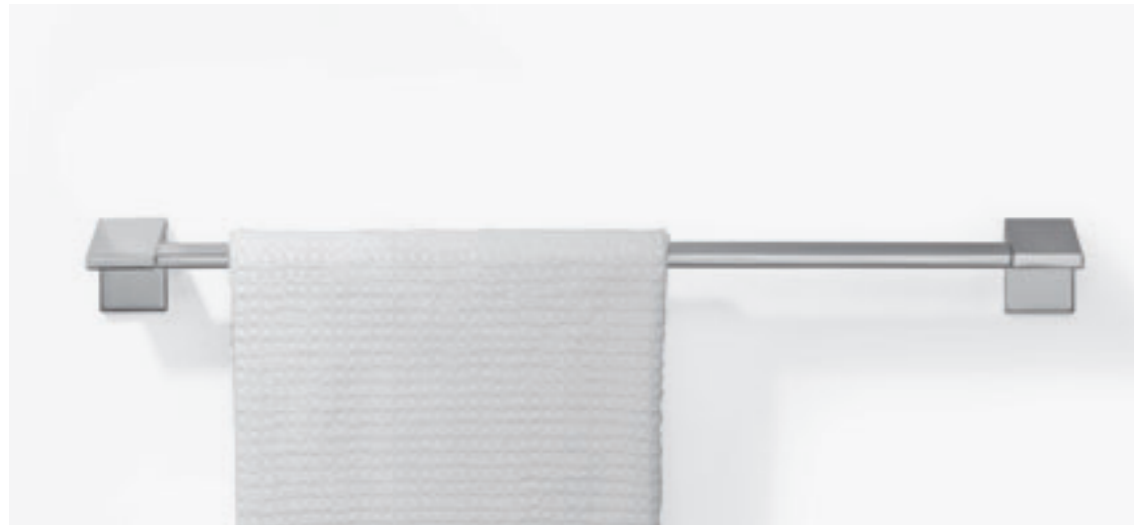
83 060 980 Towel bar, 600 mm Asta portasciugamani, 600 mm Barra para toallas de baño, 600 mm