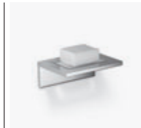
83 410 980 Soap dish wall model, complete Portasaponetta modello da parete, completo Jabonera modelo para colocar en la pared, completo