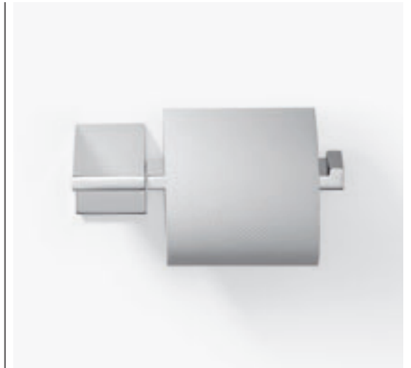
83 500 980 Tissue holder without cover Portarotolo senza coprirotolo Portarrollos sin tapa