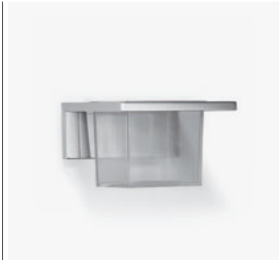
83 404 980 Glass container wall model, complete Supporto bicchiere modello da parete, completo Vaso de cristal modelo para colocar en la pared, completo