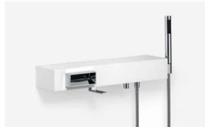
33 233 770 KATA wall-mounted single-lever bath mixer with shower set KATA miscelatore monocomando vasca esterno con doccia KATA monomando de ducha/bañera para montaje a pared con ducha de mano [26 l/min.]