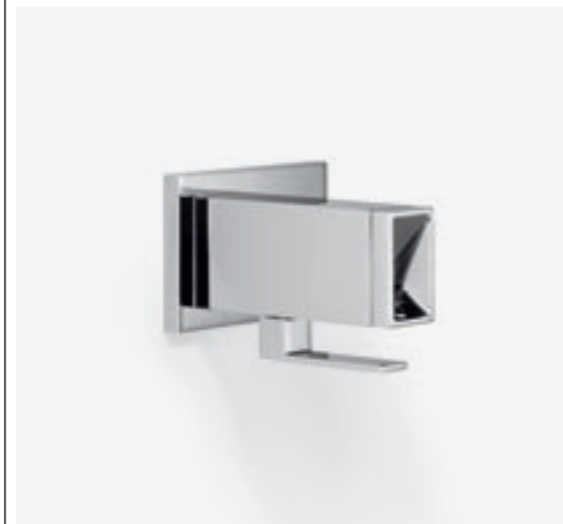
36 803 770* ITA wall-mounted single-lever basin mixer, 185 mm projection ITA miscelatore monocomando lavabo incasso, sporgenza 185 mm ITA batería monomando empotrada para lavabo, saliente 185 mm [6 l/min.]

El ELEMENTAL SPA convierte el cuarto de baño en un refugio para el alma. Cada acto ritual tiene su propia zona y cada grifería su nombre individual. Para el lavabo son ITA e IAM. KATA y NOTA son griferías de bañera para montaje a pared o exento. Para la ducha, están SATI para instalación a plafón y SANGHA para montaje a pared. La particularidad de las griferías de lavabo y de bañera: la boquilla con su forma interior de aspecto cristalino.