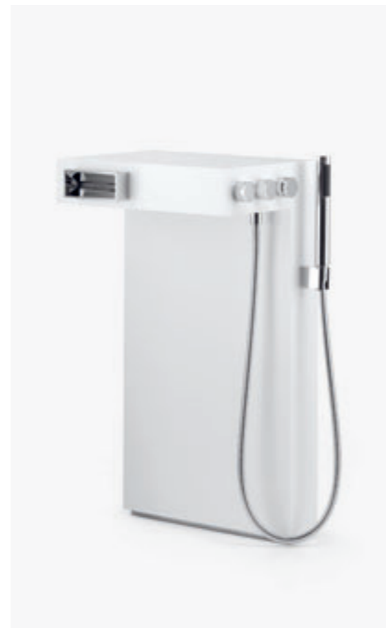
28 582 770** SANGHA shower with wall fixing SANGHA soffione a pioggia con fissaggio a muro SANGHA ducha de lluvia con fijación a pared [21 l/min.]