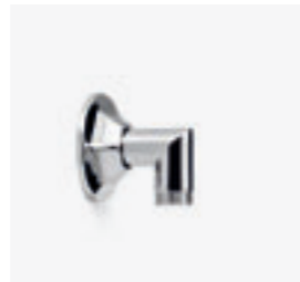
28 450 370 1/2" wall elbow Raccordo curvo 1/2" Codo de conexión a pared 1/2"