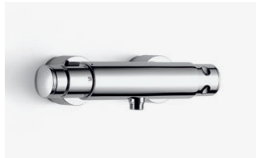
34 420 970 + 11 420 220 1/2" wall-mounted shower thermostat Termostato doccia esterno 1/2" Termostato de ducha 1/2" para montaje a pared [17 l/min.]