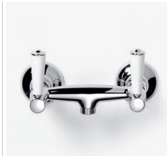
26 101 370 + 2x 11 170 370 Wall-mounted shower mixer Gruppo doccia esterno Batería bimando de ducha para montaje a pared [14 l/min.]