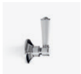
36 310 370* + 11 170 370 Wall valve Rubinetto incasso Llave de paso