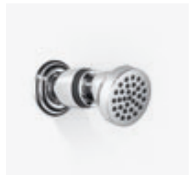
28 519 360 Body spray with volume control Soffione laterale con regolazione di portata dell'acqua Ducha lateral de masaje articulada con regulación de caudal [8 l/min.]