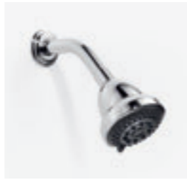
28 508 360 Shower head with three settings Soffione regolabile a tre getti Brazo articulable de ducha, ajustable en 3 modos [10 l/min.]