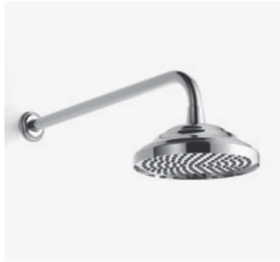
28 545 977 Shower with wall fixing, Ø 200 mm Soffione a pioggia con fissaggio a muro, Ø 200 mm Ducha de lluvia con fijación a pared, Ø 200 mm [14 l/min.]