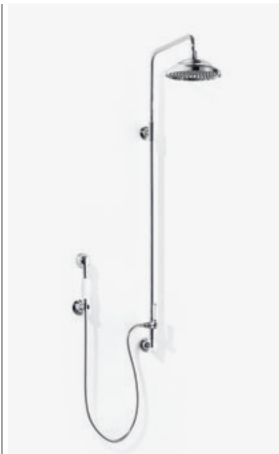
27 603 360 Shower with fixed riser with wall elbow, Ø 200 mm Doccia a stelo con gomito di uscita, Ø 200 mm Ducha de pie con codo de salida, Ø 200 mm [14 l/min.]