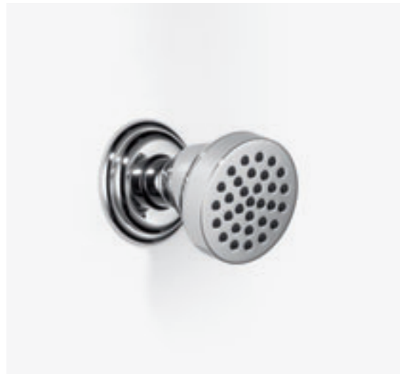
28 518 360 Body spray without volume control Soffione laterale senza regolazione di portata dell'acqua Ducha lateral de masaje articulada sin regulación de caudal [5 l/min.]