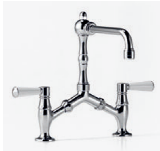
19 125 370 + 2x 11 170 370 Two-hole basin bridge mixer, 200 mm projection Batteria arcata per lavabo, sporgenza 200 mm Bateria puente para lavabo, saliente 200 mm [7 l/min.]