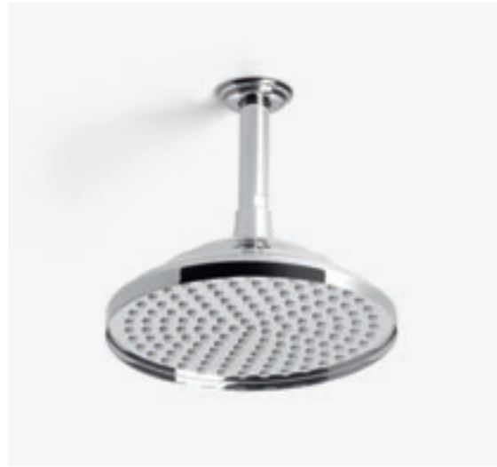
28 565 977 Shower to fix under the ceiling, Ø 200 mm Soffione a pioggia con fissaggio a soffitto, Ø 200 mm Ducha de lluvia con fijación a plafón, Ø 200 mm [14 l/min.]