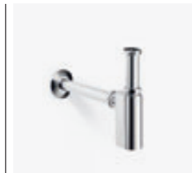
10 040 970 Siphon for basin 1 1/4" Sifone 1 1/4" Sifón 1 1/4"