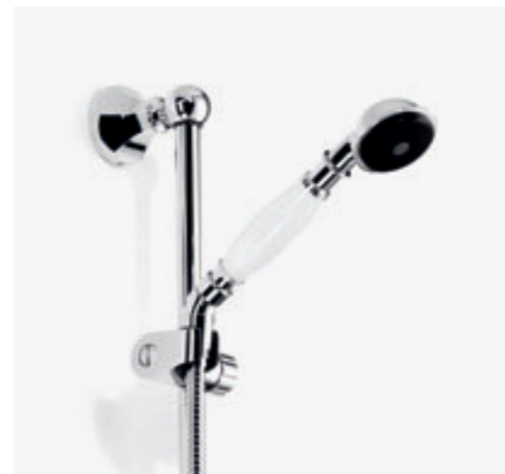
26 403 370 Complete shower set Gruppo doccia con flessibile e asta saliscendi Juego de ducha de mano con barra corredera [12 l/min.]