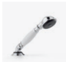
27 703 370 Deck-mounted shower assembly Gruppo doccia con flessibile montaggio bordo vasca Juego de manguera para ducha, montaje a borde de bañera [12 l/min.]