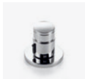
34 525 970* + 11 420 220 Deck-mounted thermostat Termostato per montaggio verticale Termostato para montaje vertical