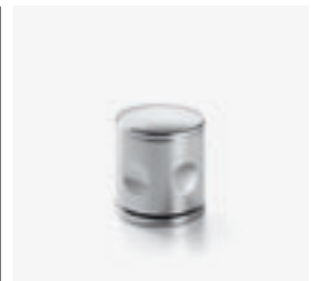
29 140 970 Two-way deck-mounted diverter Deviatore a due vie bordo vasca Inversor de dos vías para montaje a borde de bañera