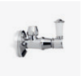
22 900 370 + 11 171 370 Angle valve 1/2" Rubinetto di chiusura a squadra 1/2" Válvula de escuadra 1/2"