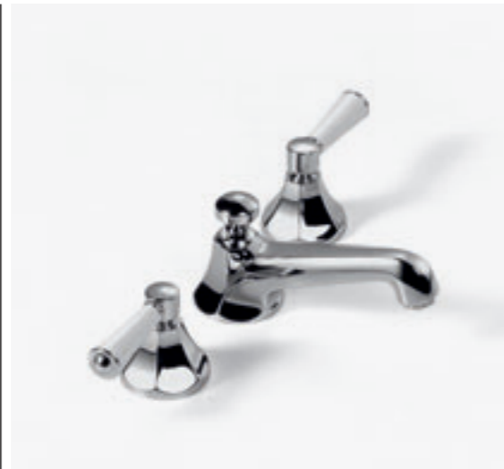
20 700 370 + 2x 11 170 370 Three-hole basin mixer, 135 mm projection Batteria tre fori lavabo, sporgenza 135 mm Bateria americana de lavabo, saliente 135 mm [7 l/min.]

MADISON FLAIR combina un encanto nostálgico con un diseño funcional. Sus manillas tan sencillas como elegantes estilizan la forma clásico-histórica. Y tiene así un toque modernista.