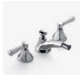
13 900 380 + 20 000 370 + 2x 04 23 30 040 00 00 + 2x 12 501 970 90 Three-hole bidet mixer Batteria tre fori bidet Bateria americana de bidet [7 l/min.]