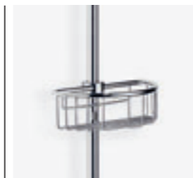
82 290 970 Shower basket for shower set Cestello doccia per gruppo doccia con flessibile Cestilla de ducha para juego de ducha