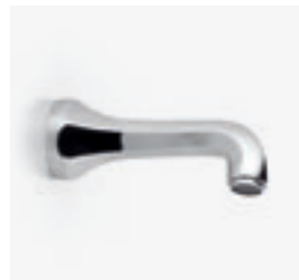
13 801 380 3/4" wall-mounted bath spout Bocca vasca montaggio a muro 3/4" Caño de bañera a pared 3/4" [22 l/min.]

* The rough parts kit for this product can be found on pages 103-105. / Il kit componenti interni di questo prodotto si trova alle pagine 103-105. / Encontrará el juego de premontaje correspondiente a este producto en las páginas 103-105.