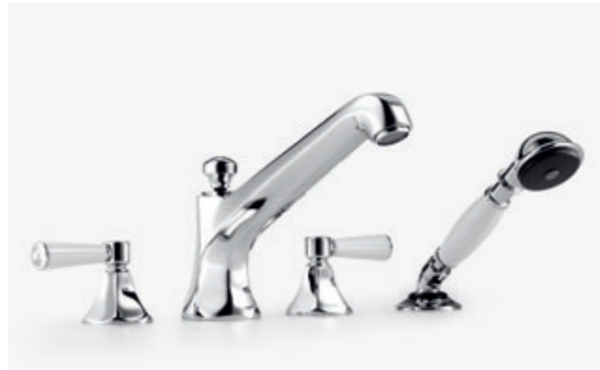
27 502 370* + 2x 11 170 370 Deck-mounted bath shower set Gruppo vasca 4 fori per montaggio bordo vasca Bateria de bañera a cuatro orificios para montaje a borde de bañera [20 l/min.]

[x l/min.] indicates the maximum flow rate at 3 bar. / [x l/min.] indica la portata massima a 3 bar. / [x l/min.] representa el caudal máximo a 3 bar.