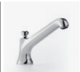
13 502 380 Bath spout with automatic bath/shower diverter Bocca vasca con deviatore automatico vasca/doccia Caño de bañera con conmutación automática bañera/ducha [23 l/min.]