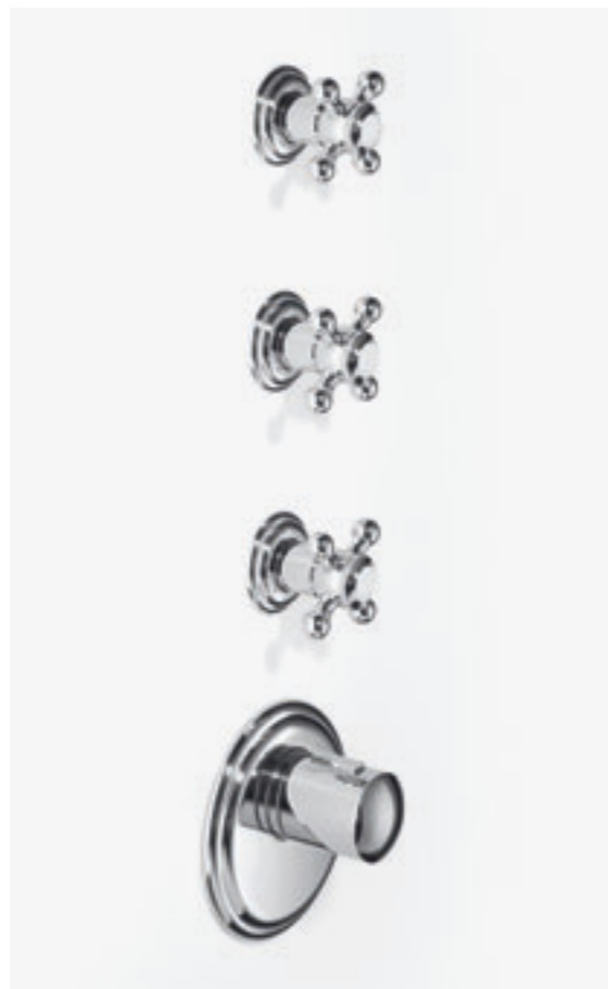
36 416 977* + 3x 36 310 360* / + 2x 36 310 360* / + 1x 36 310 360* xTool thermostat module with 3 valves/2 valves/1 valve xTool modulo termostato con 3 rubinetti/2 rubinetti/1 rubinetto Módulo de termostato xTool con 3 válvulas/2 válvulas/1 válvula