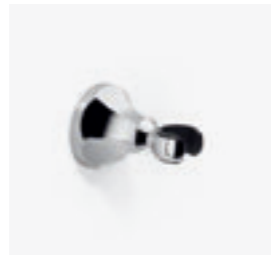
28 050 370 Wall bracket Supporto doccetta Soporte de ducha