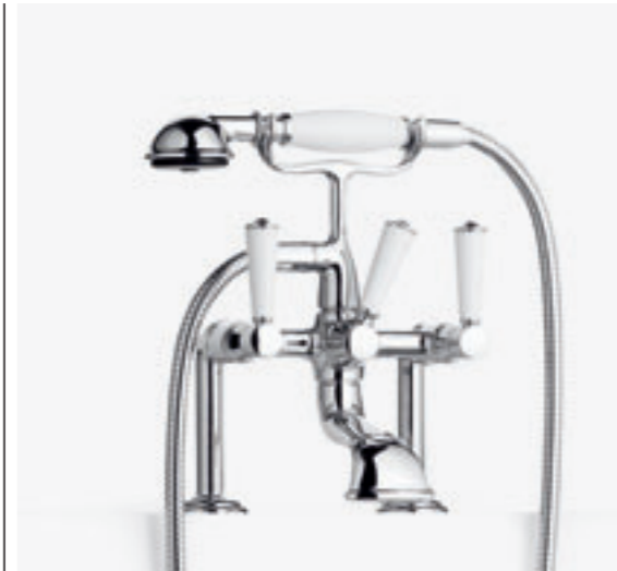
25 033 370 + 3x 11 170 370 Two-hole bath mixer with stand feet Gruppo vasca due fori e tubi verticali Bateria de bañera a dos orificios con tubos verticales [51 l/min.]

Excerpt from the product range. More detailed information can be obtained from your dealer. / Estratto dalla gamma completa prodotti. Il Vostro rivenditore specializzato sarà lieto di fornirvi maggiori informazioni. / Extracto del programa de productos. Su comercio le facilitará informaciones exhaustivas.