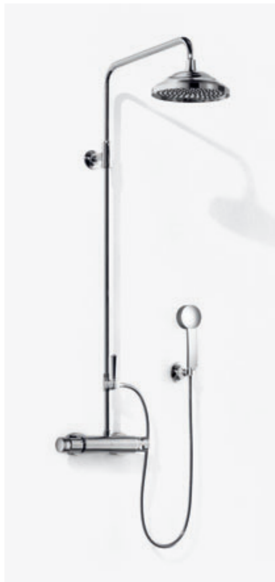
34 455 970 + 11 420 220 1/2" wall-mounted shower thermostat, Ø 200 mm Termostato doccia esterno 1/2", Ø 200 mm Termostato de ducha 1/2" para montaje a pared, Ø 200 mm [14 l/min.]