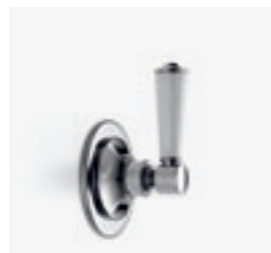
36 104 370* + 11 170 370 Concealed two- and three-way diverter Deviatore a due/tre vie da incasso Inversor empotrado de dos/tres vías