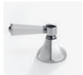
20 000 370 / 20 000 371 + 11 170 370 Deck valve clockwise closing/ anti-clockwise closing Rubinetto laterale a chiusura a destra/ a chiusura a sinistra Válvula lateral cierre a derecha/ cierre a izquierda